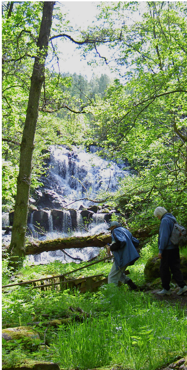
Forsen vid Röttle